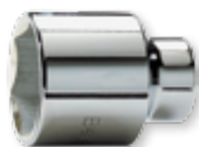
BUSSOLA / Socket

Torque screwdriver 2-10 Nm used by hand or with electric screwdriver